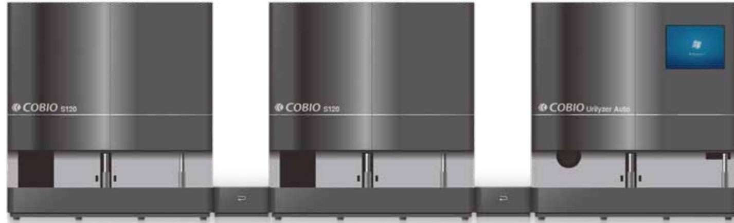
科宝S120全自动尿有形成分分析仪(2)